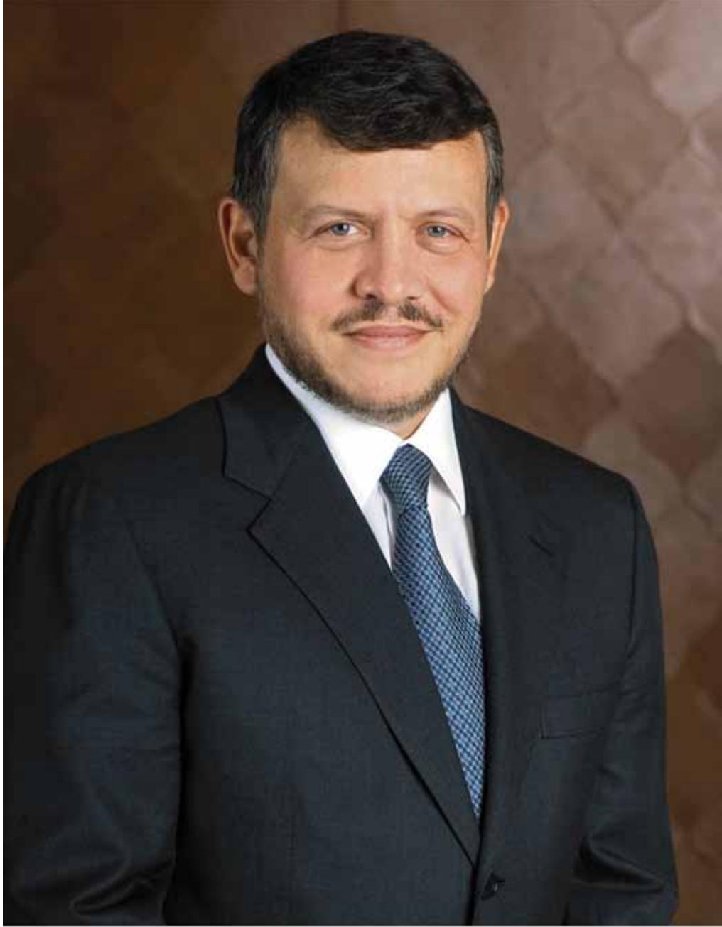
حضرة صاحب الجلالة الهاشمية الملك عبد الله الثاني ابن الحسين المعظم حفظه الله